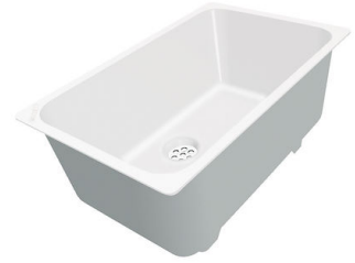
Weißer Wanne 8153 100